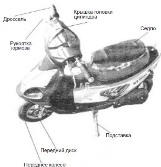
Схема мопеда и особенности сборки